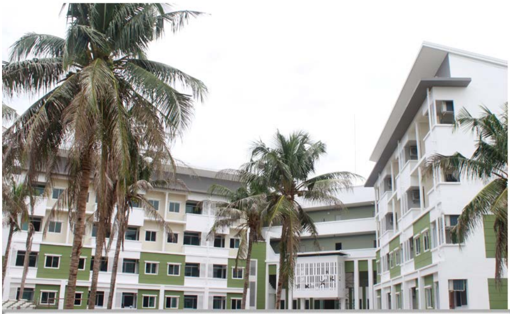
ลักษณะอาคารและห้องพักปรับอากาศ