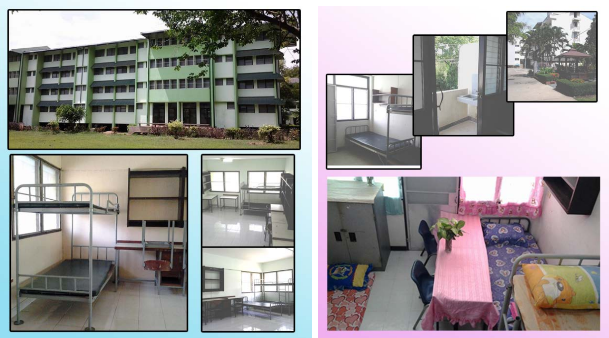
ลักษณะอาคารและห้องพักรรดา